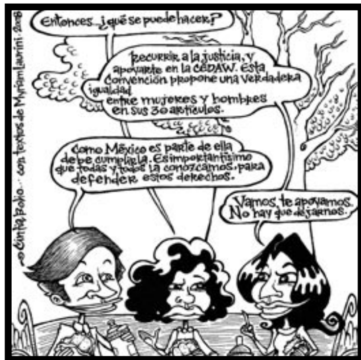
AGRADECEMOS EL APOYO DE LA FUNDACIÓN FORD PARA LA REALIZACIÓN DE ESTA PUBLICACIÓN