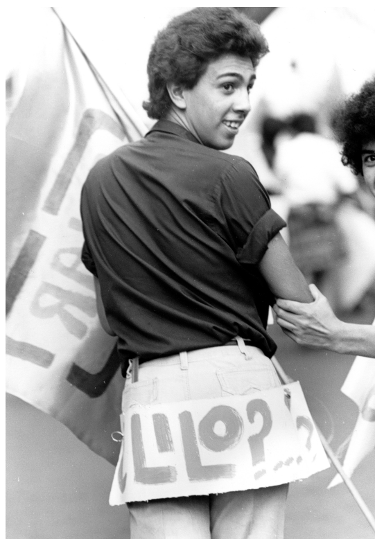
Sin título, Jorge Acevedo

besar los glúteos y ambos son “masculinos”? Ciertamente estas relaciones no están consideradas en la dicotomía. El segundo problema que advierto en esta caracterización dicotomizada es que no atiende a las percepciones y significados de los sujetos involucrados, particularmente a sus prácticas nominativas y a sus estrategias para resistir los términos de las ideologías dominantes en