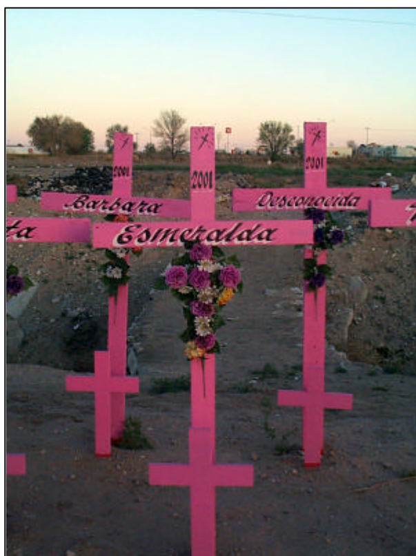
Lugar donde se recuerda a las ocho mujeres cuyos cuerpos fueron encontrados en noviembre del 2001, Ciudad Juárez.

La no identificación de los cuerpos ha impedido a las familias vivir los ritos que acompañan la muerte y el entierro de su ser querido, alterando bruscamente su proceso de duelo. No han podido sanar las heridas, obligadas a vivir con un dolor permanente que se reaviva cada vez que las noticias anuncian el hallazgo de nuevos cadáveres. La confusión generada ante la no identificación oportuna de los cuerpos y la falta de información adecuada y oficial ha profundizado todavía más el sufrimiento de las familias afectadas, causándoles mayores daños a su salud mental y emocional.