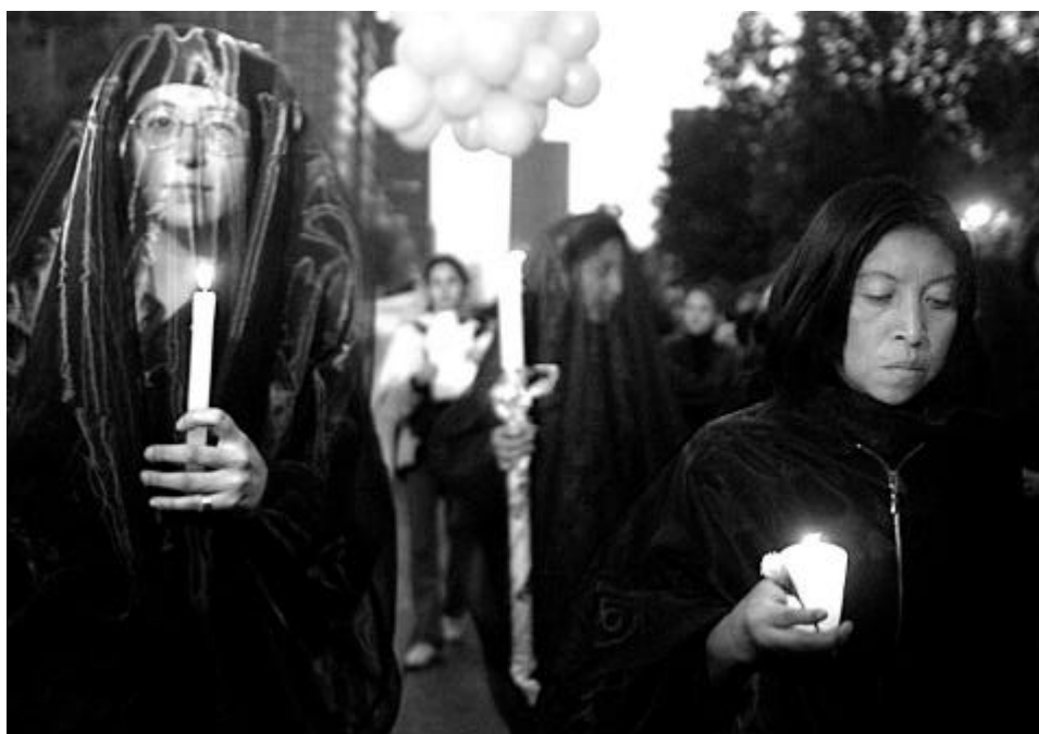
Acto de solidaridad con las mujeres desaparecidas y asesinadas de Ciudad Juárez y Chihuahua organizado por las sociedad civil.

La administración de justicia en México necesita una profunda reforma estructural para que sus procedimientos y capacidades de investigación tengan como finalidad reducir los altos índices de impunidad en todo tipo de crímenes, garantizar a las víctimas de delitos el pleno acceso a la justicia y un proceso justo al acusado que garantice sus derechos. Amnistía Internacional ha documentado durante décadas las deficiencias del sistema de justicia, en particular el papel preponderante del Ministerio Público, que le permite evitar rendir cuentas, sobre todo en la etapa de la averiguación previa.