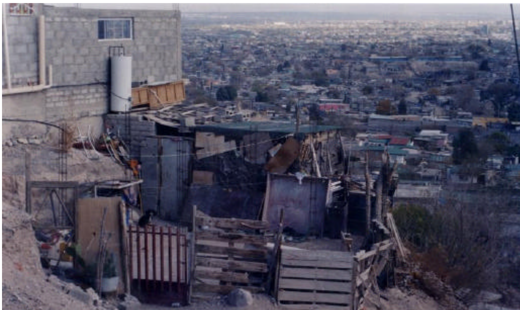
Imagen de Anapra, una colonia marginada de Ciudad Juárez

Según cifras oficiales del año 2000, el 43 por ciento de los habitantes de Ciudad Juárez llegaron allí como migrantes, generando una población flotante muy alta. Esta población ha creado su propio espacio en la ciudad, en lugares desfavorecidos en los que se refuerzan mutuamente la pobreza, el deterioro de la vivienda y los servicios urbanos, la criminalidad y la degradación ambiental. La polarización social y urbana dio como resultado una ciudad de fuertes contrastes. En un extremo se observan ciertos enclaves ricos y en el otro, zonas muy pobres y deterioradas. El paisaje urbano es una mezcla de grandes sectores industriales y centros comerciales, áreas con todos los servicios, vías pavimentadas y arboladas, con enormes lotes baldíos, caminos sin pavimentar, desierto, pequeños caseríos rodeados de basurales y calles anónimas sin ningún tipo de mobiliario urbano. La marginalización de esta parte de la población constituye un grave obstáculo para los derechos de las mujeres en Ciudad Juárez si se tiene en cuenta que las víctimas de la violencia contra la mujer pertenecen en su gran mayoría a los sectores más vulnerables.