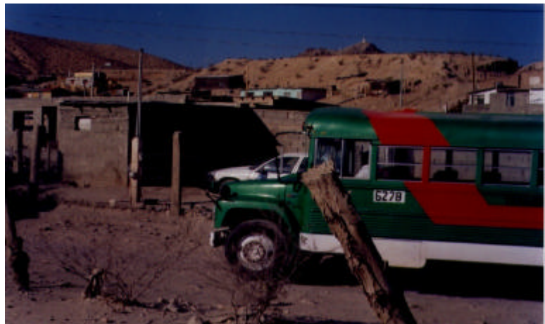
Ciudad Juárez., camión de transporte de trabajadoras de la industria maquiladora

A mediados de los años sesenta el Estado mexicano adoptó el Programa de Industrialización de la Frontera Norte, creando las condiciones necesarias para la instalación en la zona de empresas ensambladoras de productos de exportación, las llamadas maquiladoras . Desde entonces las relaciones económicas entre Estados Unidos y México se han estrechado. Las ventajas ofrecidas a las empresas para establecer fábricas en la zona ha supuesto que una gran cantidad de compañías transnacionales se instalen para aprovechar las condiciones favorables, incluyendo mano de obra barata, impuestos muy reducidos o inexistentes, el patrocinio político y sólo unas normas reguladoras mínimas.