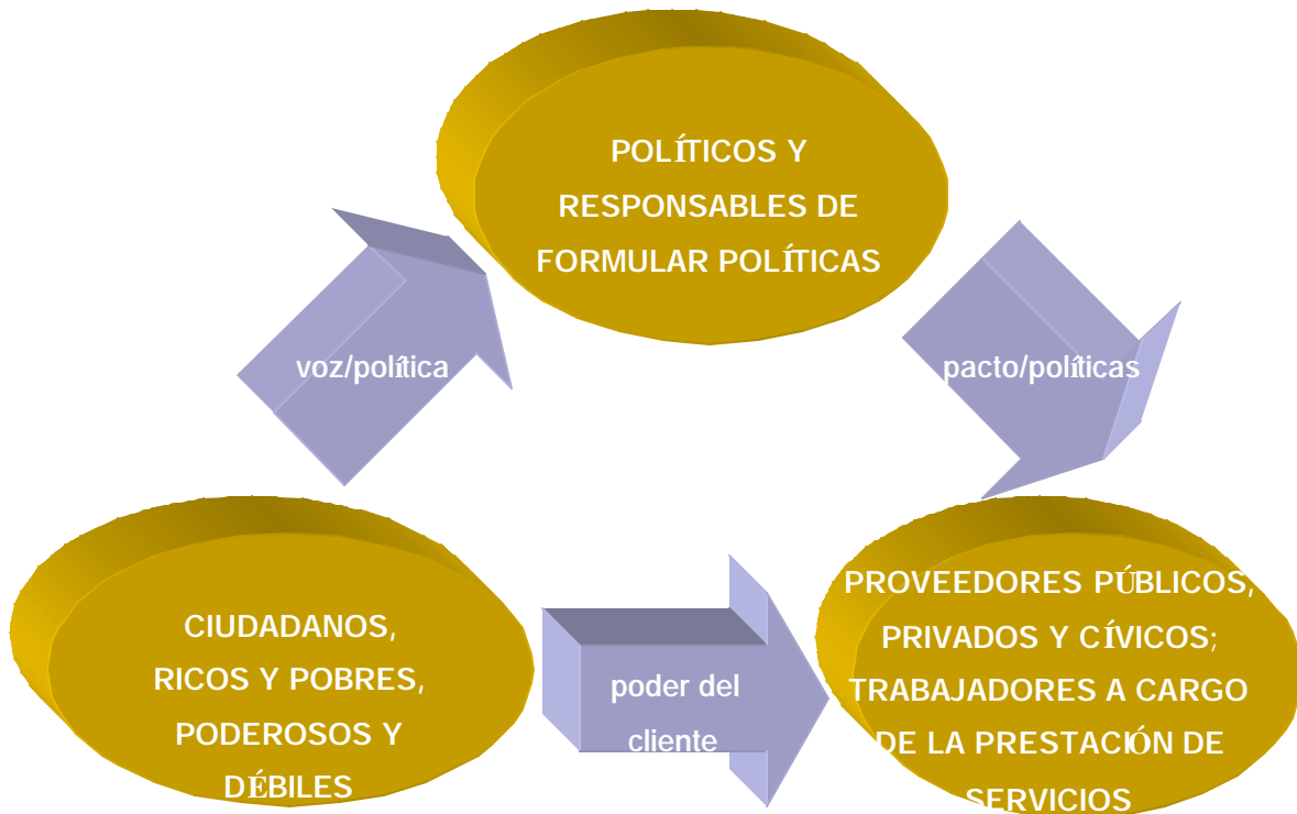
Gráfico 3: Relaciones de responsabilidad y rendición de cuentas

Aumentar la participación no sólo es posible en teoría, existen un par de ejemplos muy concretos. Los programas educacionales compensatorios de México otorgan a los pueblos indígenas un papel en la gestión escolar y el proceso de aprendizaje. En materia de salud, la responsabilidad puede verse fortalecida por medio de la información que ofrecen las ONG y otros grupos respecto de las prácticas óptimas en el ámbito de la salud; los servicios comunitarios como los programas de vacunación pueden subcontratarse (aunque siempre con financiamiento público); y la atención clínica puede prestarse mediante subsidios por lado de la demanda. Por medio de un proceso competitivo formal, Nicaragua, Honduras, El Salvador y Panamá adjudican contratos a las ONG para que atiendan a las poblaciones remotas (con frecuencia indígenas) sin o con poco acceso a atención de salud, a cambio de pagos per cápita fijos y anuales.