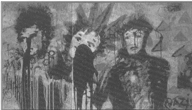
D.R. PEINT SUR LE MUR

Il nous faut bien entendu continuer le débat en nous positionnant publiquement dans nos divers pays sur les finalités de l'école et de la formation, sur les politiques scolaires et de la jeunesse. Avec cette utopie réaliste, qu'en période de «vaches maigres» l'Etat préservera l'essentiel, c'est-à-dire qu'il